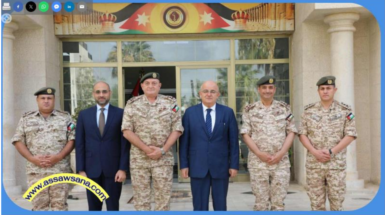
نصت الإتفاقية على توفير التعليم والتدريب لطلبة الكليات والتخصصات الطبية